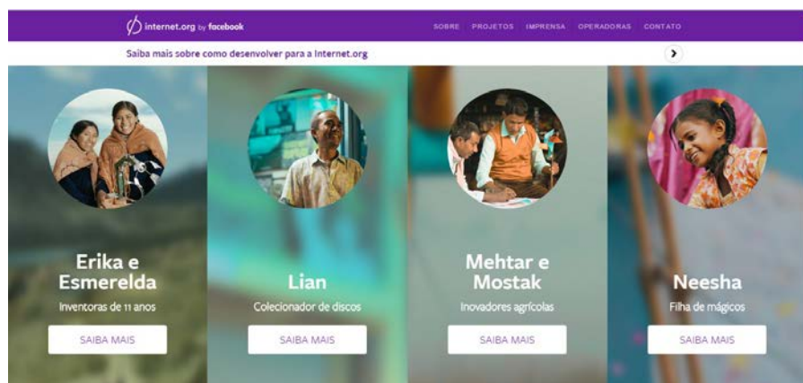
Figura 2 www.internet.org

Nas palavras de Pêcheux (1995, p. 164), “... o pré-construído corresponde ao “sempre-já-aí” da interpelação ideológica que fornece-impõe a “realidade” e seu “sentido” sob a forma da universalidade (o mundo das coisas)”. Que “realidade” e que “sentidos” dão forma ao nosso mundo das coisas na busca pela conectividade total? Que sentidos para o moinho de vento de Mehtar e Mostak? Ou para o mundo mágico de Neesha? Ou para a pequena loja local de discos de Lian? Ou ainda para o incrível invento do braço de robô de Erika e Esmeralda? Personagens que protagonizam as histórias divulgadas pelo Facebook na campanha do Internet.org. Que realidade e que sentido o discurso da conectividade fornece-impõe aos sujeitos sob a forma da universalidade?